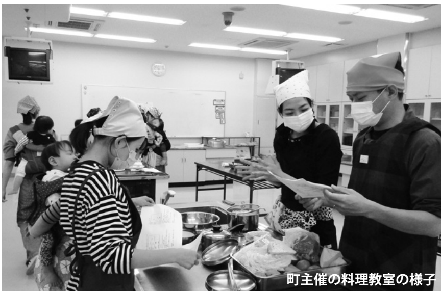
町主催の料理教室の様子

参加する場合もあります。子育て支援センターが実施する「離乳食・幼児食講習会」でも父親の参加がみられます。質問の、男性向け離乳食講習会、祖父母向け幼児食教室の開催については、現在開催している教室に、父親や祖母の参加が増加傾向にある状況を踏まえ、父親など家族の方が気兼ねなく参加できるような教室運営に努めて参ります。