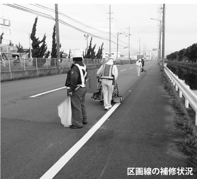
区画線の補修状況

また、建設課に頂いた情報が、他の道路管理者や公安委員会が管理する路面標示であった場合は、速やかに情報を共有し、対応を依頼しております。