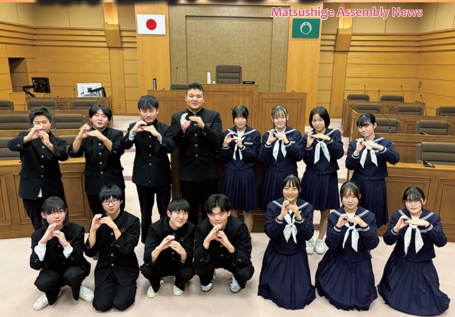
松茂町議会と中学生との会議