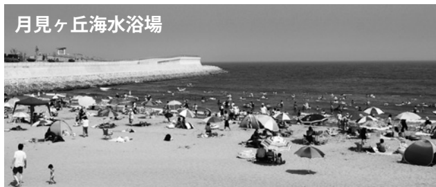
月見ヶ丘海水浴場

ては、商工振興費、海水浴場監視及び安全対策等委託料107万7千円の減額は、天候等による開催日数の減少など、実績により減額補正するものです。