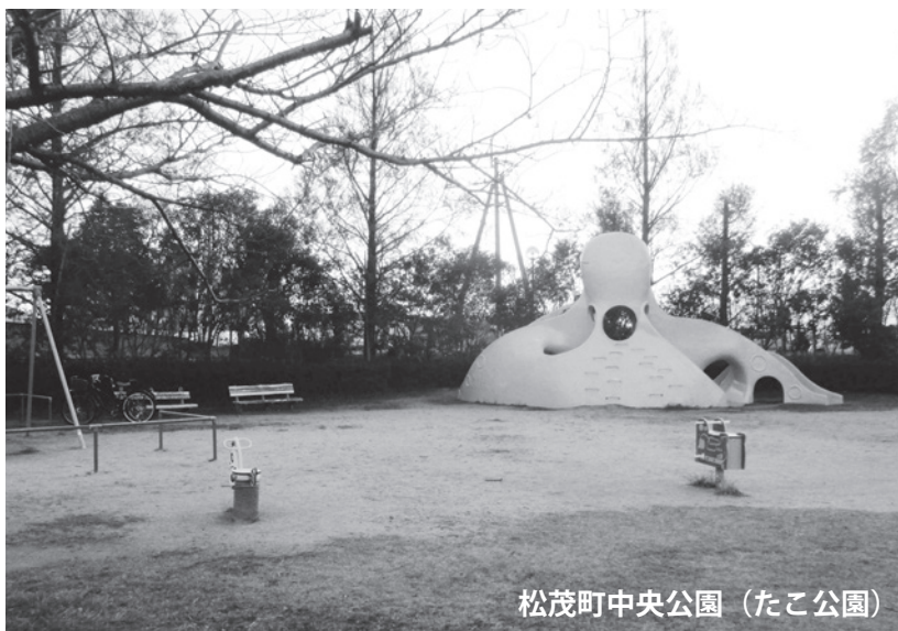
松茂町中央公園（たこ公園）

松茂中央公園の遊具の整備に向け、今後、遊具についてのアンケートや、健康遊具についてのニーズを把握し、種類や規模、設置スペース、予算など、計画的な設置に向けて検討します。