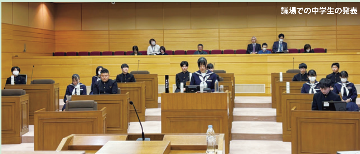
議場での中学生の発表

令和7年11月21日（金）松茂町役場議場において、松茂町議会議員と松茂中学校の3年生15名が「松茂町議会と中学生との会議」を行いました。