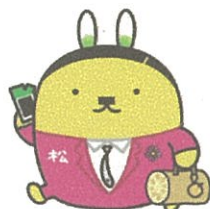
松茂町マスコット「松茂係長」

ダンボールだけを必ず紙ひもで束ねて出しましょう。ダンボールの中に新聞や雑誌、ダンボールを入れて出すのはやめましょう。異物は取り除いてから出しましょう。