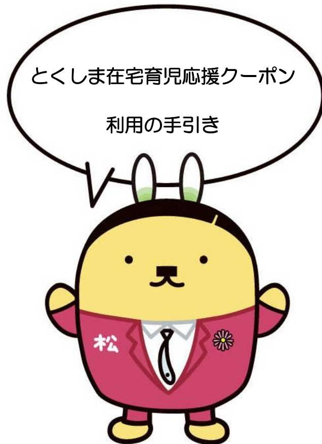
松茂町マスコットキャラクター「松茂係長」

松茂町では、町内に住民票がある3歳未満のお子様を在宅で育児する保護者の方を対象に、子育て支援サービスの利用料にあてることができるクーポン券を交付しています。