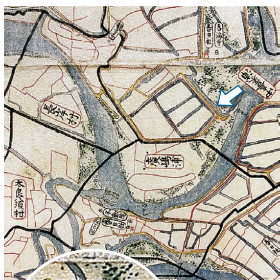
矢印部分拡大図 堤防が黄色で表されている

この小規模な干拓に「越」と「張・ハリ」のルーツがあります。「越」は、堤防を「越す」ことを意味し、「張・ハリ」は、堤防の中にできた新しい田畑を意味しました。