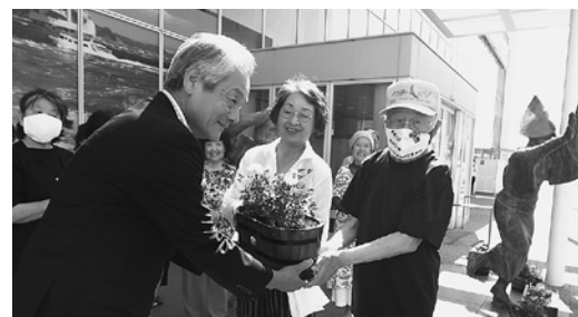
植え付けは、松茂町花づくり会のみなさんにご協力いただきました！

松茂町では“美しいまちづくり”を推進しています。この活動の一環として、「徳島阿波おどり空港」正面玄関に花の寄せ植えを設置しました。みなさま、お近くにお越しの際は、ぜひ色とりどりの花々をご覧ください。