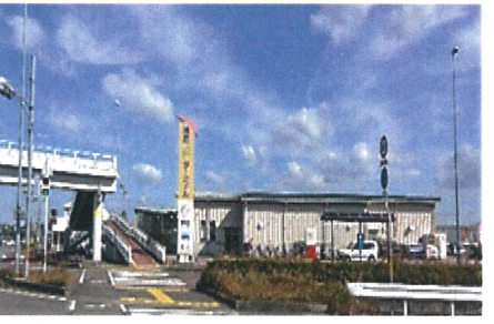
①とくとくターミナル