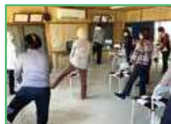
通いの場の様子(百歳体操)